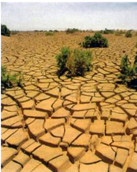
Abbildungen 191 und 192: Impressionen im Chott el Jerid