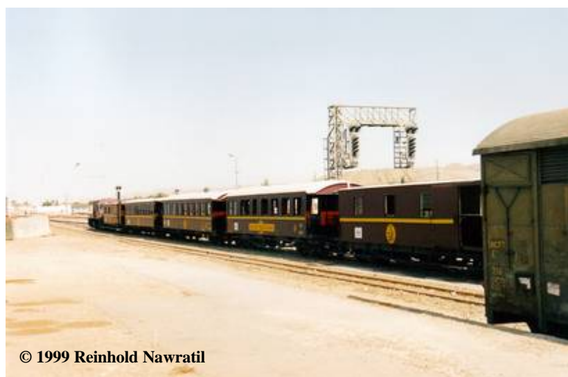
Abbildungen 215 bis 217: Impressionen des ‚Lezard Rouge‘