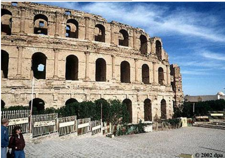
Abbildung 75: Kolosseum