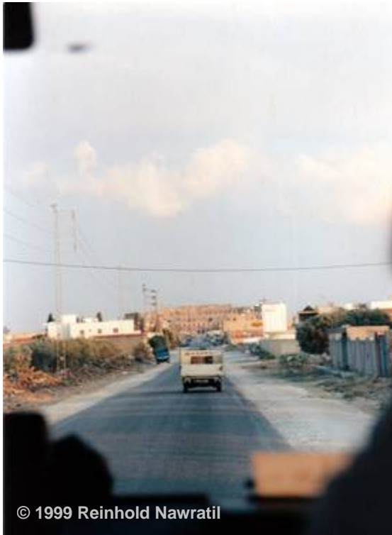
Abbildung 74: Auf zum Gladiatorenkampf in ‚El Jem‘ auch ‚el Djem‘