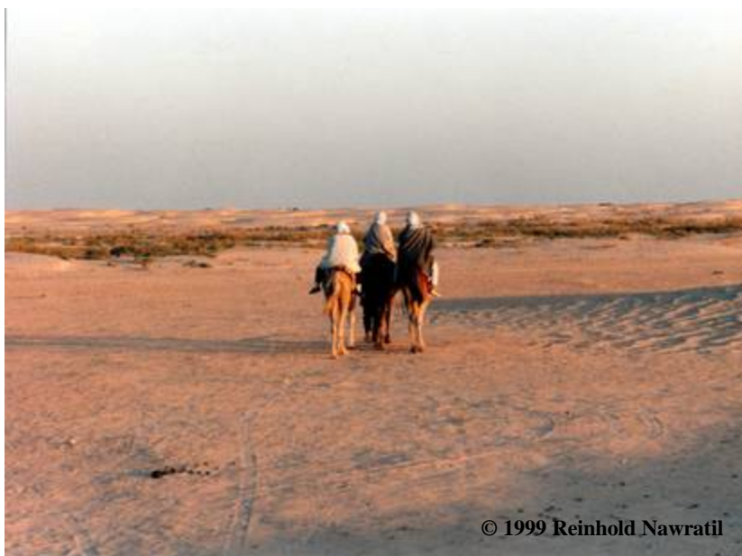
Abbildung 180: Die Führungsgruppe – der Hirte ist verdeckt, der die Dromedare führt. Abbildungen 181 und 182: Wir warten auf den Sonnenuntergang